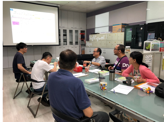
說明 4: 系上老師決議學習歷程參採內容