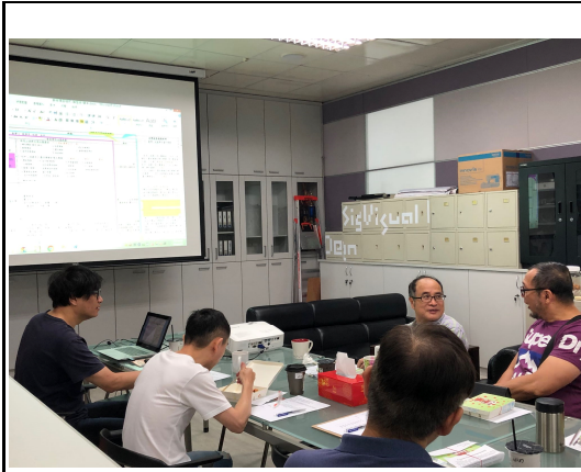
說明 3: 系上老師分享以往書面審查經驗