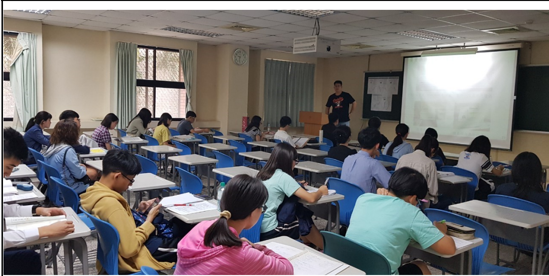
說明 2：本系行政同仁向家長與考生介紹本系特色